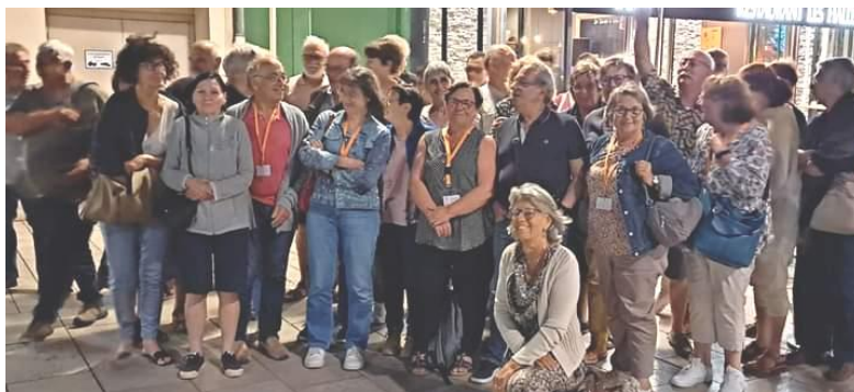
Représentants des UTR de la Nouvelle Aquitaine

Le mercredi soir l'URR a convié toutes les UTR de la Nouvelle Aquitaine.